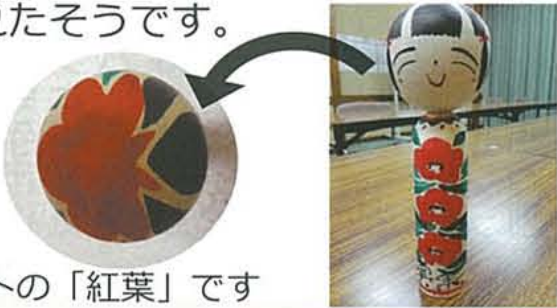
チャームポイントの「紅葉」です