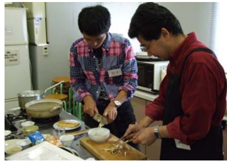
料理に初めて挑む方も！

十月十七日(土) からだ館料理教室「男の料理」を出羽庄内国際村にて開催しました。