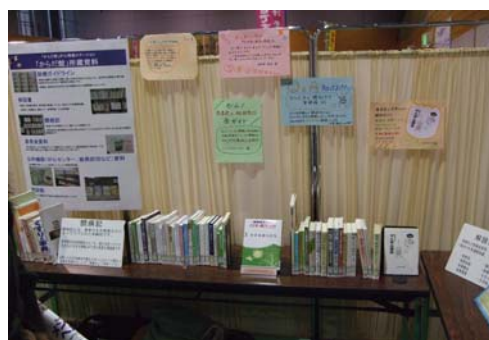
ブース内に設置したミニ図書館

たびに歓声が上がると、終始和やかな雰囲気です。イベントの合間には「からだ館紹介ビデオ」を放映、資料の紹介、出会の場の提供、今まで行ってきた各種の勉強会の模様などを紹介しました。会場からは「鶴岡にこんなところがあったんだ」「今まで図書館には行かなかったけど...」など、今度立ち寄ってみようという声が上がりました。