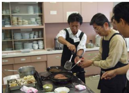
ハンバーグに挑戦！！

「お父さんだっておいしい料理で家族をよろこばせたい」、「たまにはお母さんを休ませてあげたい」、そんな思いから始まった企画です。メニューは大きなハンバーグ、旬の味覚いっぱいきのこの鍋、お口直しのトマトサラダ、そして松茸風味の簡単炊き込みご飯です。