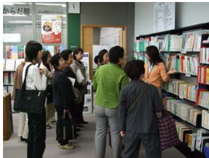
書籍の前で説明を聞く参加者

施設見学では初めて来られた方も多く活発な意見や質問が飛び交い、とても充実した見学会となりました。見学会は随時受け付けています。お気軽にお問い合わせください。(小野博美)