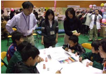
クイズに挑戦する子供たち

十月十八日(土) 鶴岡市主催の「市民健康のつどい」が小真木原総合体育館の多目的ホールを会場に開催されました。